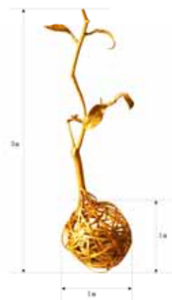
四. 作品尺寸說明圖