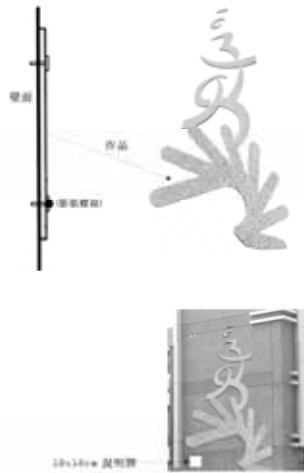
五. 安裝方式及說明牌位置