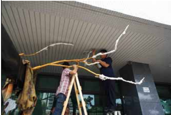
圖 5 現場安裝 天花板定位