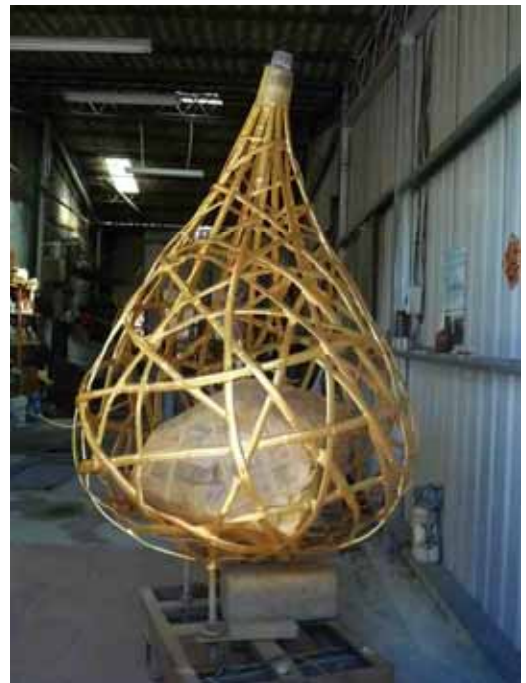
圖 8 主體中心 完成噴漆