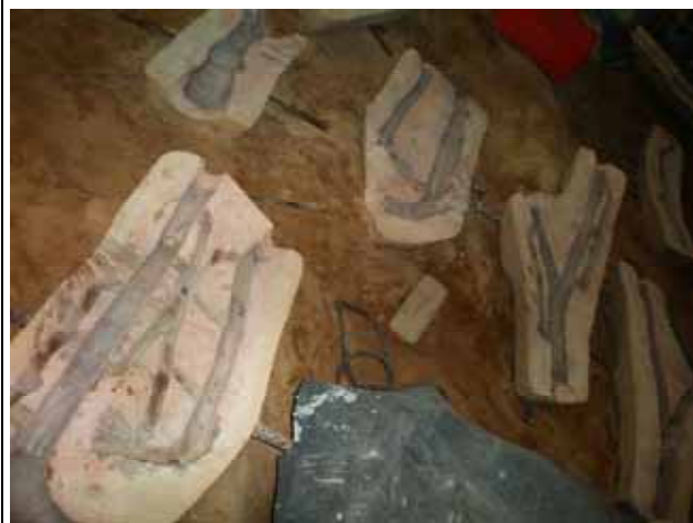
圖 3 工廠 翻製模型 片狀