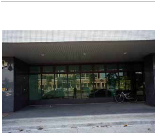
圖 1 設置地點 安裝前基地