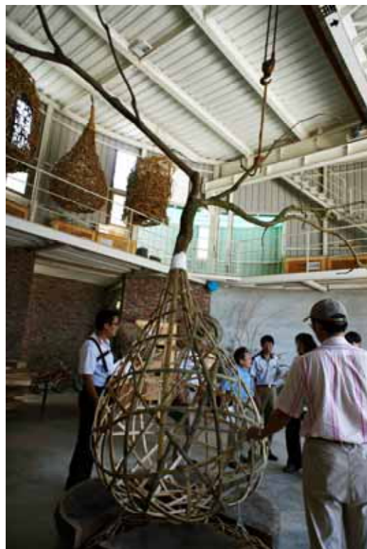
圖 2(藝術家工作室) 翻模前 委員勘驗