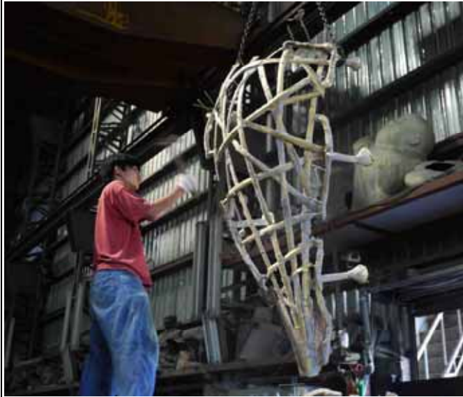
圖 5 工廠 將表面油漬、灰塵擦拭淨