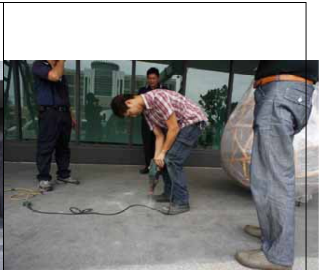
圖 2 現場安裝 地板鑽孔