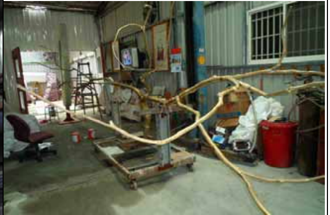
圖 6 工廠 局部翻製完成