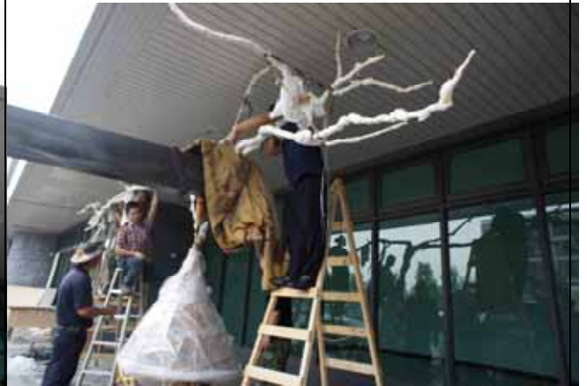
圖 6 現場安裝 細部定位