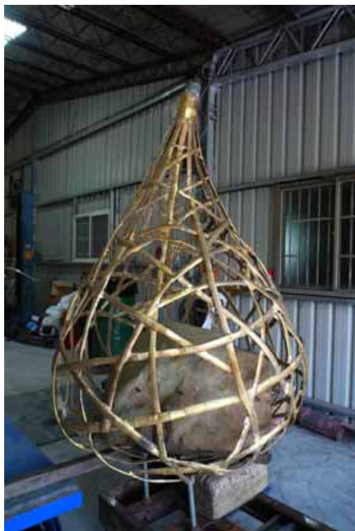
圖 1(藝術家工作室) 1:1 原模製作完成

圖 3 至圖 8 【科豐國際有限公司之工廠】-桃園縣蘆竹鄉海山路二段 392 號