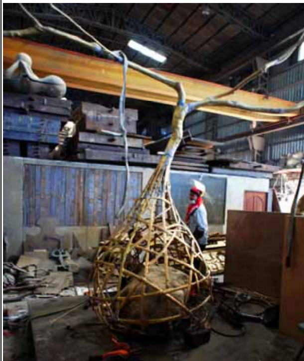
圖 7 工廠 整體試組裝