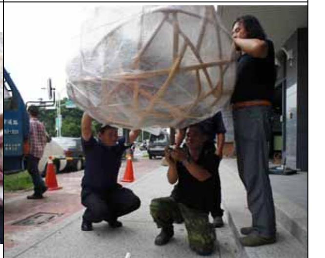
圖 4 現場安裝 主體就位置