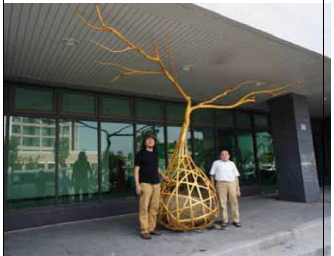
圖 8 現場安裝完成(藝術家、建築師合影)