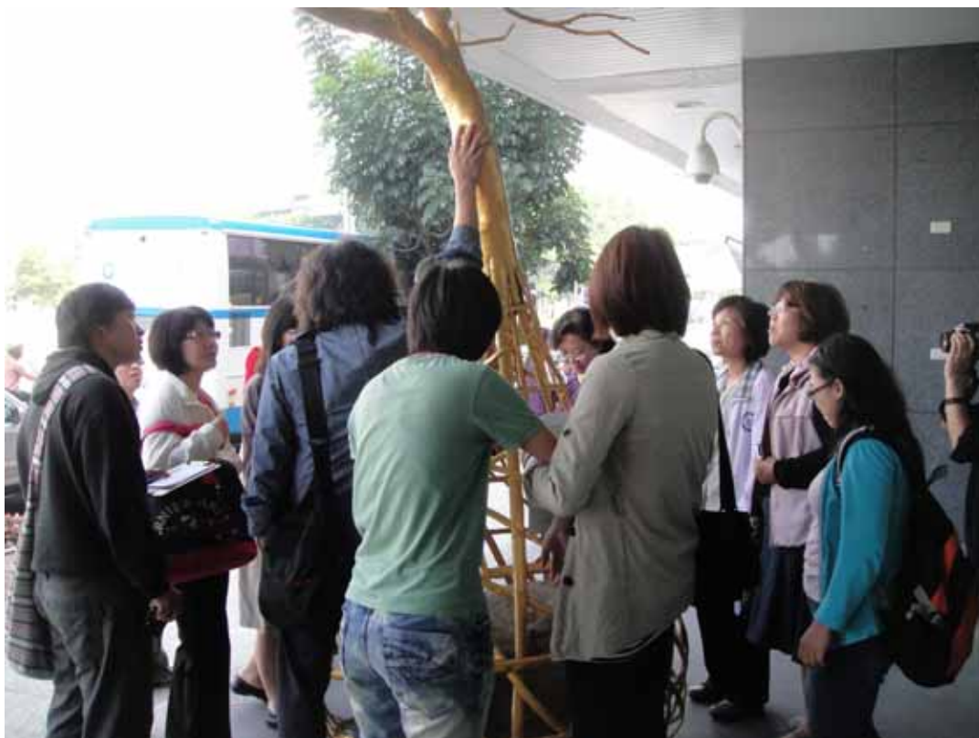
藝術家現場導覽解說相片：