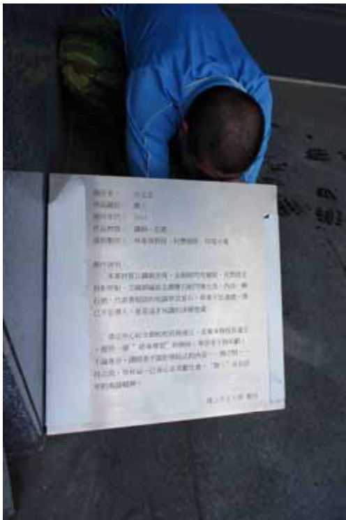
圖 7 作品解說牌現場安裝